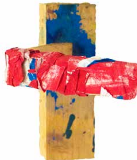
Conduttore, 2020 Carta da disegno riciclata incollata su legno recuperato, incollato e dipinto con tempera e acrilico, 60 x 5,5 x 3 cm; 17 x 20 x 5,5 cm