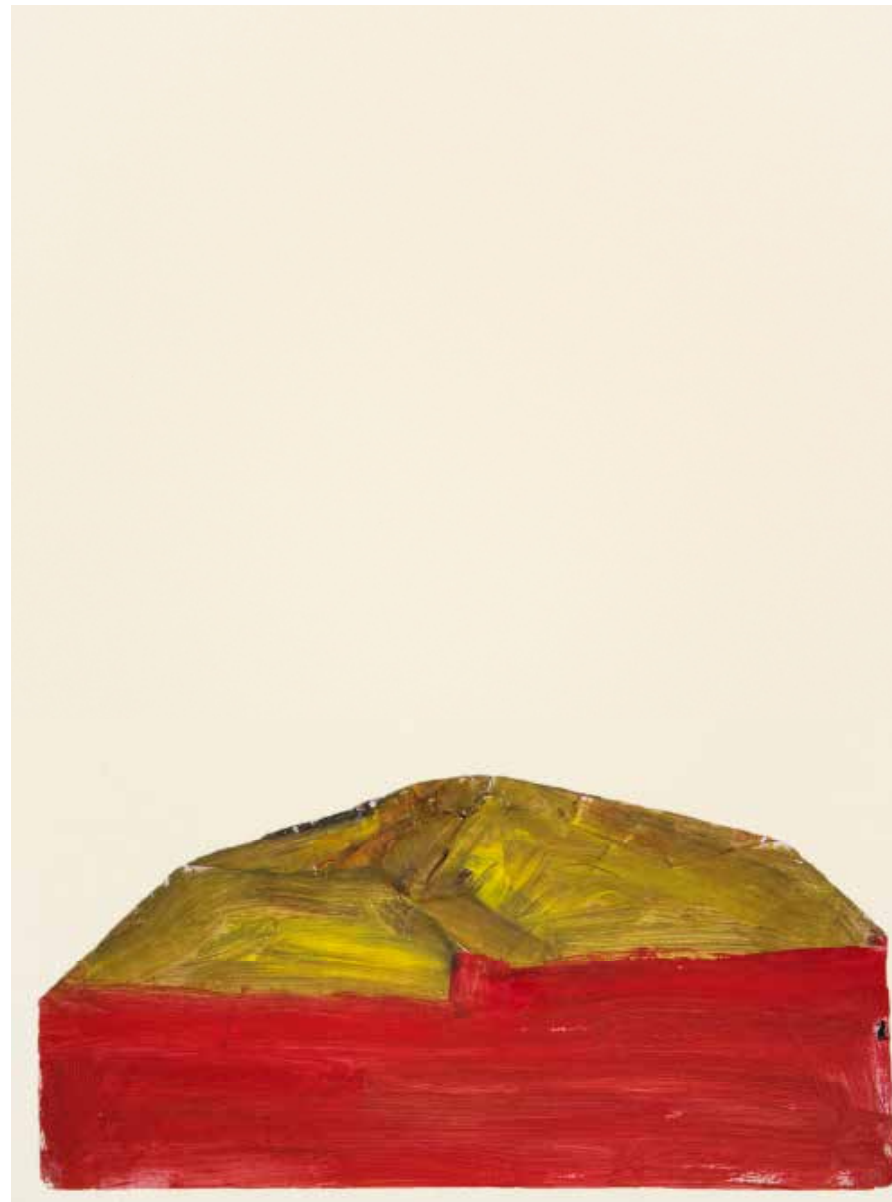
Cattedrali , 2018 Tempera e colla vinilica diluita su carta da pacco bianca ripiegata incollata su supporto di cartone vegetale, 50 x 70 cm x 2mm