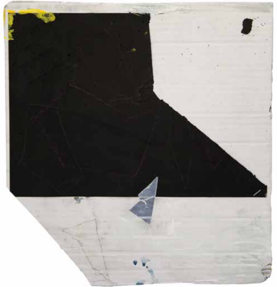
Collage, 2019 Collage, cartone recuperato e dipinto, carta incollata e dipinta con tempera, grafite e pastello a olio, 28,5 x 32 x 2 cm e 30,5 x 30,5 x 2 cm