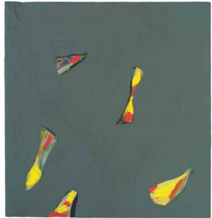
Intermittenze , 2020 Tempera, acrilico e resina acrilica, pigmento, pastelli a olio, carboncino, gesso di bologna su tela di cotone leggero grezzo, carta gommata applicata sui bordi, 58 x 40 x 4 cm; 50 x 48 x 4 cm